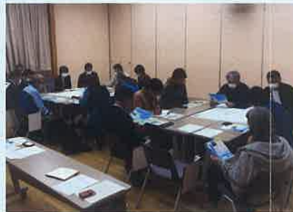
支笏湖の適正利用の検討に関する会議の開催