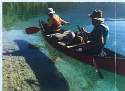
カヌーでのゴミ回収