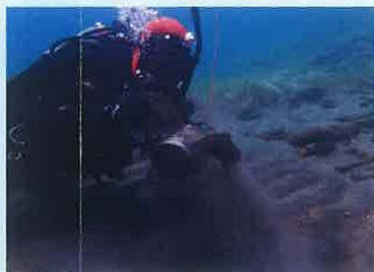
湖底清掃