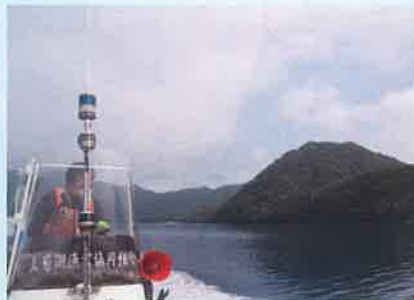
エリアパトロール